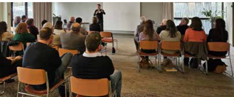
Formation au Management Positif®