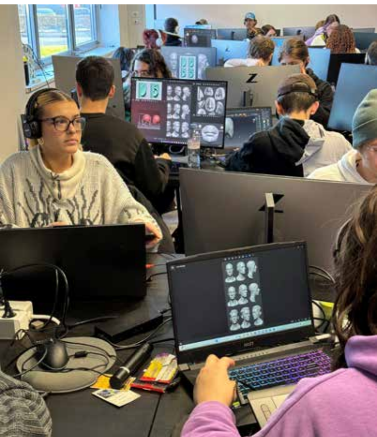
Un cours à e-artsup Tours